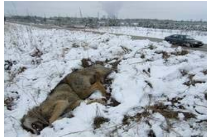
Kontaktbüro Wolfsregion Lausitz