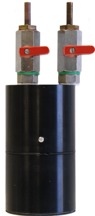
Abb. 1: Lucas-Kammer (Abmessungen in mm)