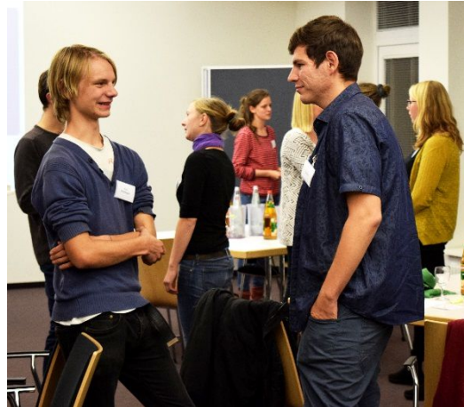
Bürgerforum Junge Generation

Die Foren starteten jeweils am Freitagabend um 18 Uhr und endeten am Sonntagmittag um 13 Uhr. Das Konzept für den Ablauf setzte insgesamt auf eine diskursive, eigenverantwortliche Arbeitsweise der Bürger/innen.