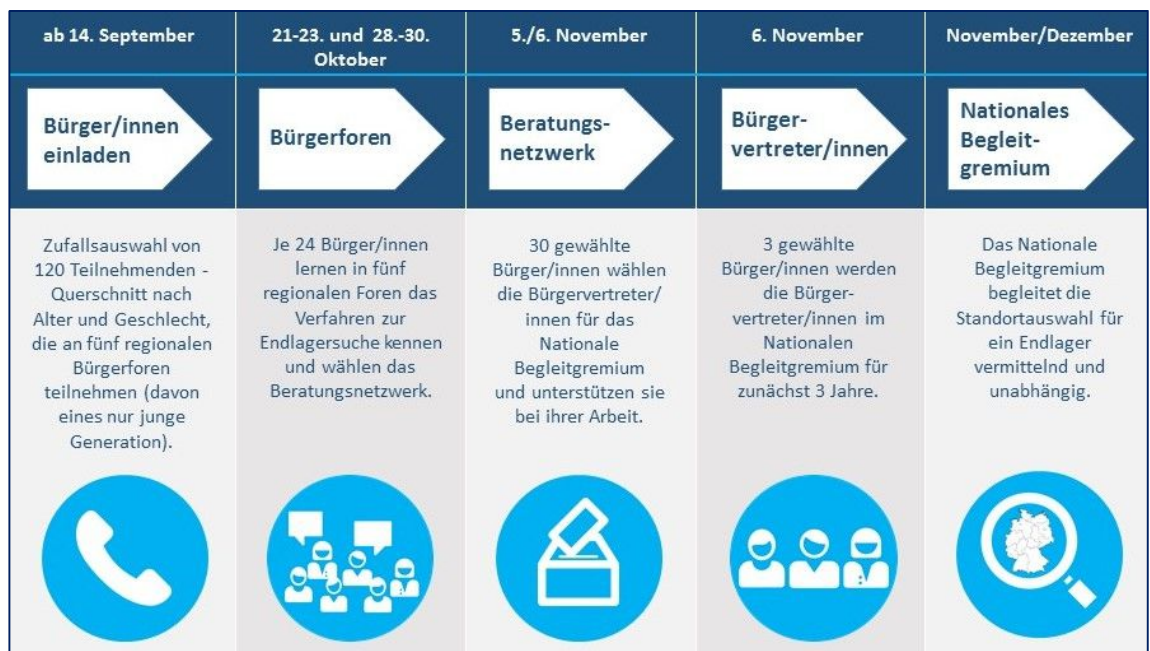
Abbildung: Zeitlicher Ablauf bis zum ersten Treffen des Nationalen Begleitgremiums in 2016

Nach dem StandAG hat die Bundesumweltministerin die Aufgabe, drei Bürger/innen für die Mitarbeit im Nationalen Begleitgremium (NBG) zu benennen, die zuvor in einem dafür geeigneten Verfahren der Bürgerbeteiligung nominiert worden sind.